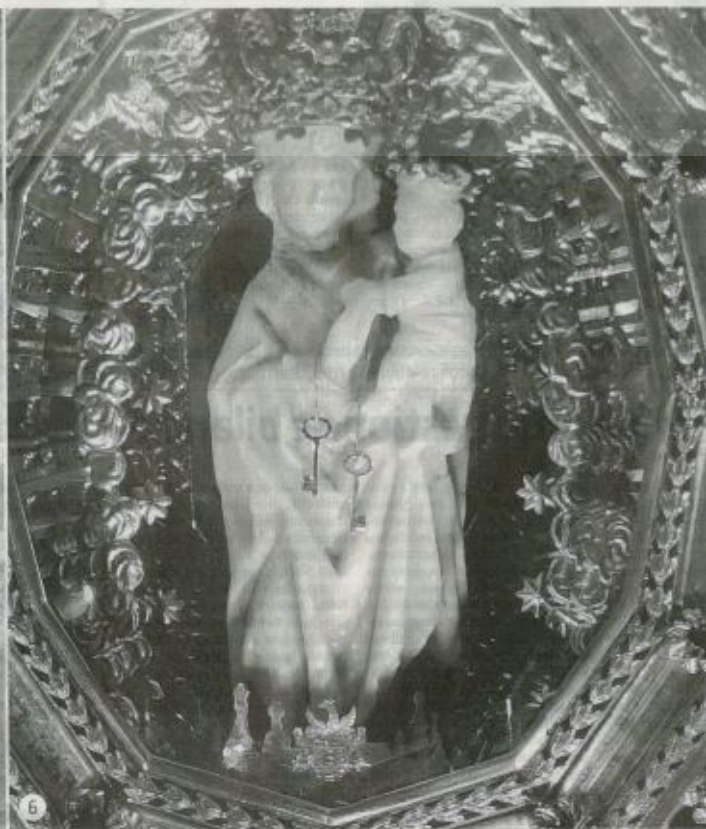
3 Fedeli e visitatori nella Grotta 4 Don Giacomo Putaggio 5 L'affresco di San Nicola 6 la statuetta della Madonna della Cava